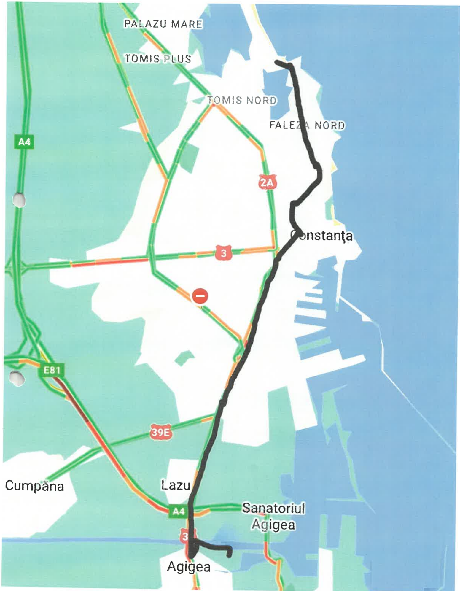
ANEXA 1.3. ACM 3