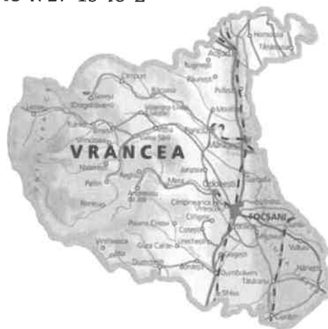
Harta 1. Poziția orașului Mărășești în județul Vrancea

Geografic se află situat la o distanță de 20 km nord de municipiul Focșani, reședința județului Vrancea, 27 km sud de municipiul Adjud, 18 km vest de municipiul Tecuci, județul Galați, 18 km est de orașul Panciu. Coordonate geografice: 45°52'48"N 27°13'48"E