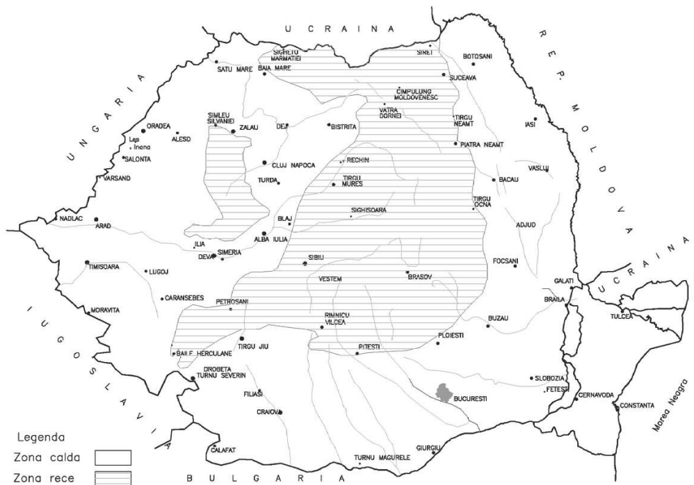
Fig. 9 – Zonare climatica

5.4 Adezivitatea se determină obligatoriu atât prin metoda cantitativă descrisă în SR 10969 (cu spectrofotometrul) cât și prin una dintre metodele calitative - conform SR EN 12697-11 sau normativ NE 022.